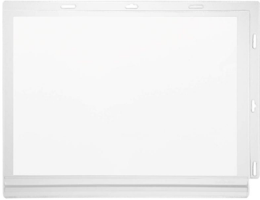
Moldura A4 Prova Água DURABLE 502719 Com Cabos