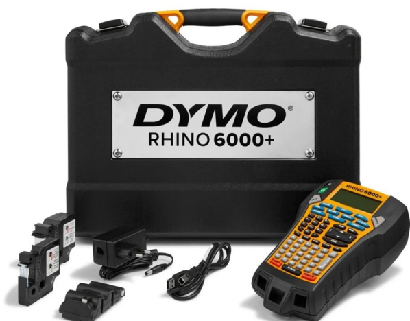
Impressora Etiquetas DYMO Rhino 6000+ (Com Mala)